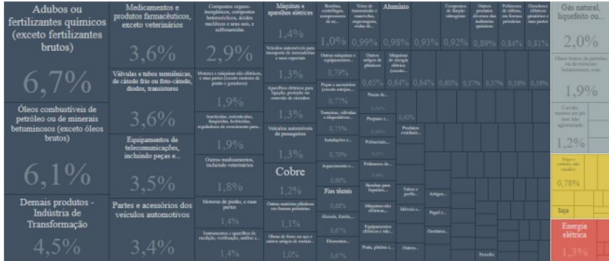
Gráfico 1 – Os principais produtos importados pelo Brasil durante o ano de 2021

Segundo dados coletados pelo MDIC, o Brasil é o 29º maior importador do mundo. Suas principais importações se concentram em Adubos e Fertilizantes (com 13,4 bilhões gastos), óleos combustíveis de petróleo (12,1 bilhões), e demais produtos da indústria de transformação (8,9 bilhões).