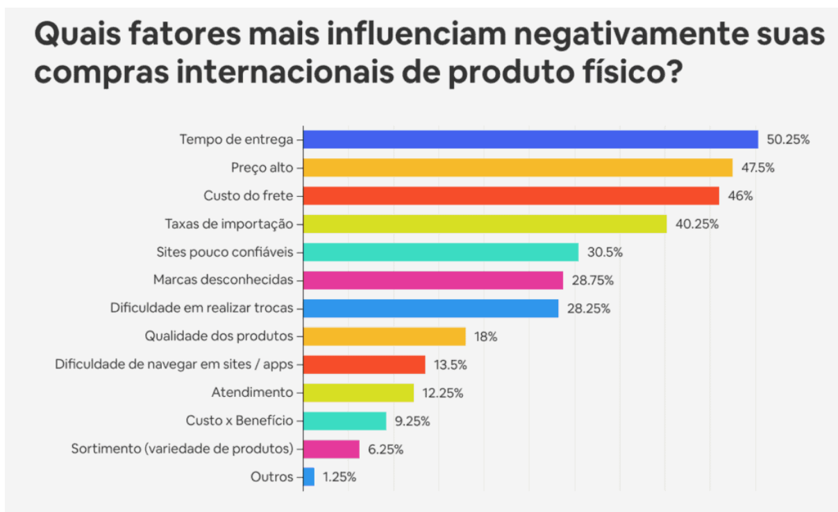
Tabela 3 – Cross Border