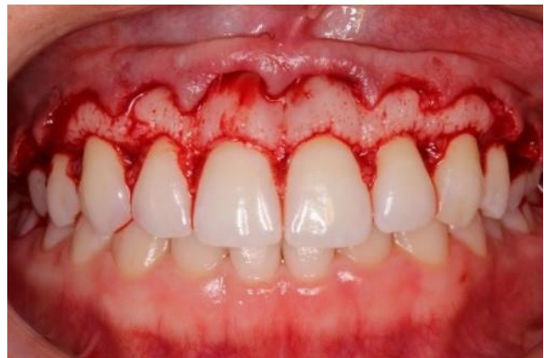
Figura 8. Pós-cirúrgico 30 dias.