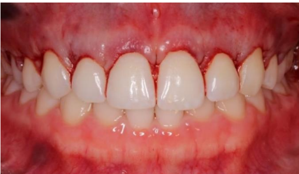
Figura 5. Após remoção do colarinho gengival do hemiarco direito até primeiro molar.

O guia cirúrgico possibilitou uma maior precisão das incisões iniciais. Um colarinho gengival foi removido com a utilização de cureta Gracey 7/8, (Figura 5) rebatendo um retalho de espessura total para permitir osteotomia e osteoplastia (Figura 6).