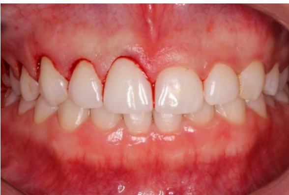
Figura 6. Rebatimento do retalho total para permitir a remoção de tecido ósseo.

Com o auxílio da alta rotação utilizando broca esférica sobre irrigação abundante com soro fisiológico foi realizado a remoção de osso, reestabelecendo o espaço supracrestal, proporcionando uma distância de 3mm da JCE a crista óssea. Após esta etapa o retalho foi reposicionado e suturado com fio 5.0 Nylon Black