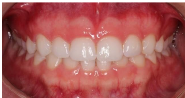
Figura 2. Foto inicial intraoral.

Diversos métodos são descritos na literatura como forma de executar esse tipo de cirurgia, o método proposto para a paciente foi realizar o procedimento através do auxílio de um guia cirúrgico previamente confeccionado (Figura 3), com todas as distâncias biológicas estabelecidas. Com o consentimento da paciente, a etapa seguinte foi realizar o escaneamento intraoral, necessário, juntamente com a T.C, para a confecção do guia.