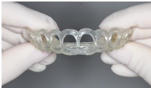
Figura 3. Guia Cirúrgico.

Diversos métodos são descritos na literatura como forma de executar esse tipo de cirurgia, o método proposto para a paciente foi realizar o procedimento através do auxílio de um guia cirúrgico previamente confeccionado (Figura 3), com todas as distâncias biológicas estabelecidas. Com o consentimento da paciente, a etapa seguinte foi realizar o escaneamento intraoral, necessário, juntamente com a T.C, para a confecção do guia.