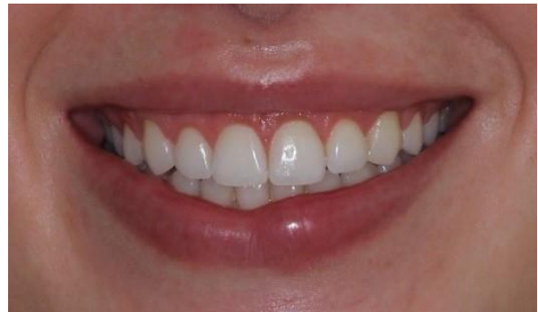
Figura 7. Pós-operatório imediato.

Uma outra vantagem do guia foi possibilitar um menor tempo cirúrgico. A paciente recebeu as orientações pós-operatório e foi prescrito uso de dexametasona no pré e pós cirúrgico mais amoxicilina e toragesic no pós-cirúrgico. O primeiro pós-operatório foi realizado com 7 dias e as suturas removidas no segundo pós-operatório com 15 dias. O último controle pós-operatório foi realizado com 30 dias, onde foi realizado uma foto final para documentação (Figura 8). A paciente não apresentou nenhuma queixa e relatou estar extremamente satisfeita com o resultado.