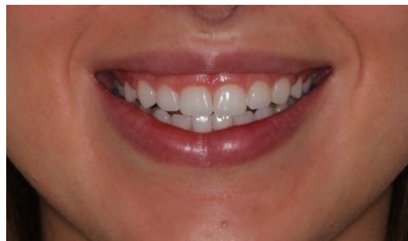
Figura 1. Foto inicial extraoral.

Ficou estabelecido, através da análise da T.C que seria realizado remoção de tecido gengival e tecido ósseo do dente 16 ao dente 26 mantendo uma distância de 3 mm da junção cimento-esmalte a crista óssea.