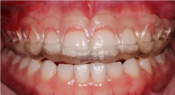
Figura 4. Guia Cirúrgico em posição

Após aprovação do projeto, o guia foi enviado e a cirurgia foi agendada. No ato cirúrgico, com o guia em posição (Figura 4), foi realizado inicialmente a remoção de tecido gengival do dente 16 ao 26 com incisões em bisel interno realizadas contornando a margem gengival pré-estabelecida no modelo, seguida de incisões intrasulculares.