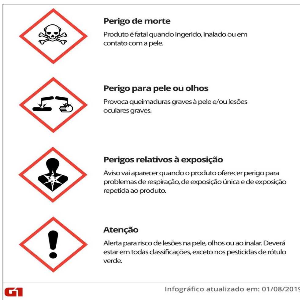
FIGURA 2 - Símbolos que irão aparecer nos rótulos das embalagens para alertar sobre os riscos que o consumidor deve se atentar ao utilizar o produto.

A retirada do pictograma da caveira, antes disposta em todos os invólucros, também não agradou alguns especialistas. Isso porque ela somente será usada para as duas categorias consideradas mais perigosas. Com isso, produtos considerados “moderadamente tóxicos”, “pouco tóxicos” ou “improváveis de causar dano agudo” não terão o símbolo no rótulo (figura 02) (SAMPAIO, 2019).