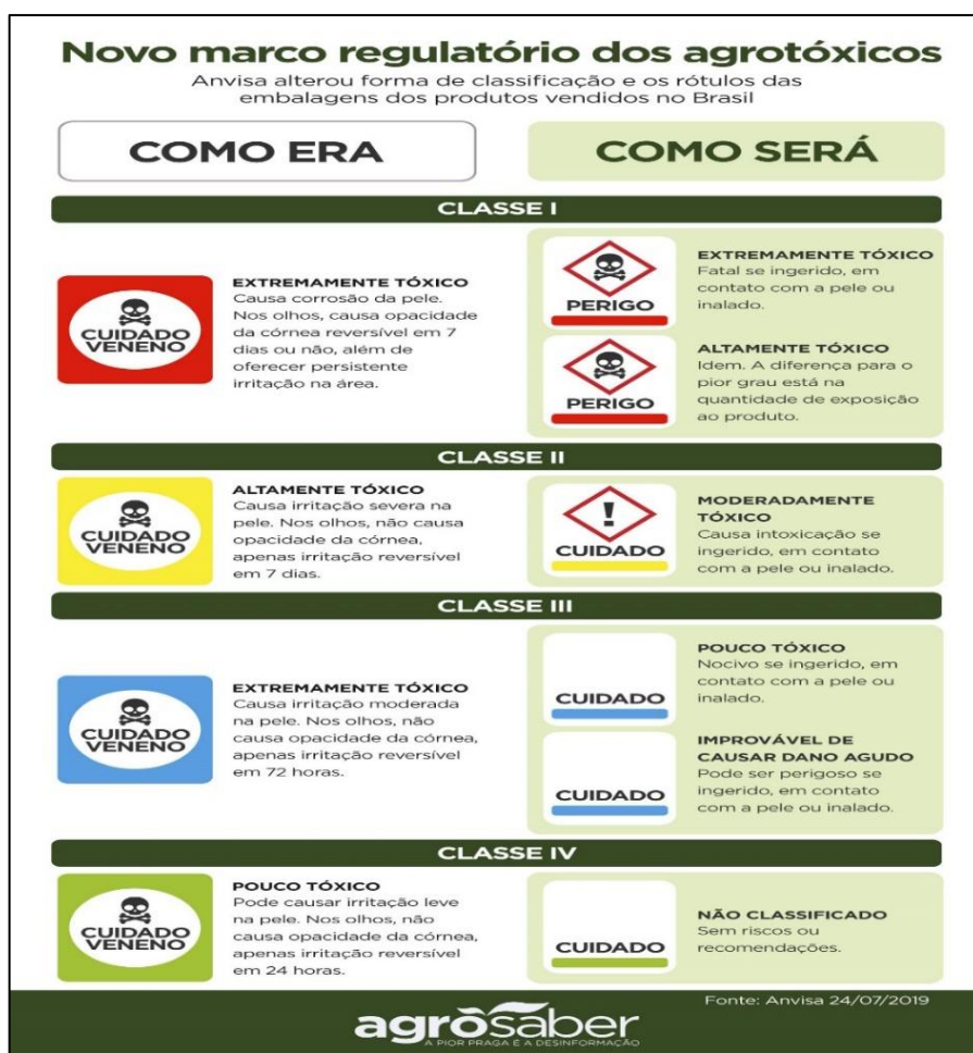
FIGURA 1 – Nova classificação do nível de toxicidade dos agrotóxicos segundo a ANVISA. Infográfico elaborado em 24 de julho de 2019.

Conforme apresentado na figura 01 o GHS ampliou de quatro para cinco as categorias da classificação toxicológica dos agrotóxicos, além de incluir o item “não classificado”, válido para produtos de baixíssimo potencial de dano, por exemplo, os produtos de origem biológica. Essa ampliação impede uma comparação real entre a classificação toxicológica anterior e a reclassificação atual, que tem como base o no padrão GHS (ASCON; ANVISA, 2019).